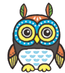
当グループキャラクター