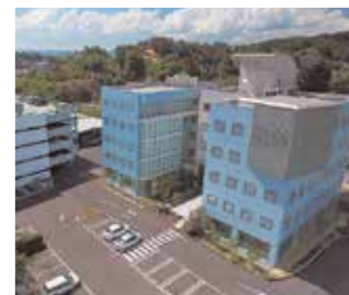
雷神館(アウルホールディングス本社外観)

岡山市環境整備事業協同組合 中国圏産業廃棄物処理事業協同組合 一般社団法人岡山環境検査センター