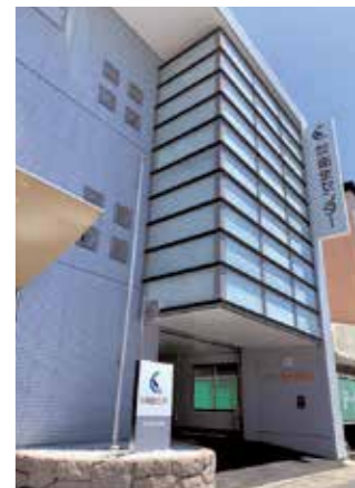
サンライズビル(本社外観)